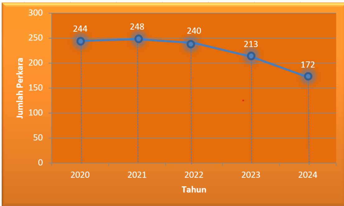
Gambar 2 Jumlah Penerimaan Perkara di Pengadilan Negeri Raha Tahun 2020-2024